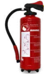
Wasserslöschers Aufladegerät WU 6nG Brandklasse A