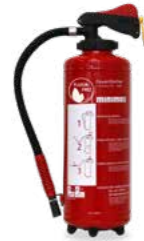
Schaumlöschers Aufladegerät WX 6 nG fluorfrei Brandklassen A und B