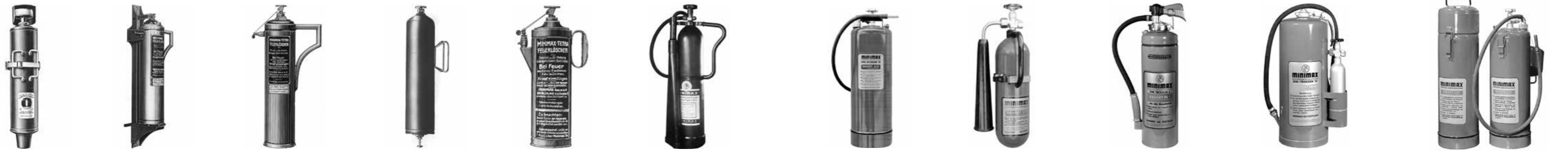
Historische Produkte vom Beginn des 20. Jahrhunderts bis in die 1970er Jahre