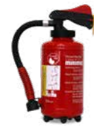
Fettbrandlöschers Aufladegerät WF 3nG Brandklassen A und F