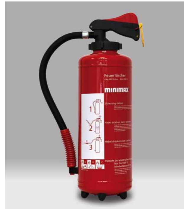
Minimax tragbarer Feuerlöscher aus der aktuellen Baureihe

Minimax produziert Feuerlöscher, und das nicht erst seit gestern, sondern seit mittlerweile über 120 Jahren. Minimax hat den ersten seriengefertigten tragbaren Feuerlöscher in großer Stückzahl auf den Markt gebracht, die so genannte »Spitztüte«. Schon dieses kegelförmige, rot lackierte Modell mit einem Schlagknopf an der Unterseite und einer Spritzdüse an der Spitze zeichnete sich – wie alle Folgemodelle bei Minimax – durch eine Einhandbedienung aus. Aber wir verlassen uns nicht nur auf unsere erfolgreiche Geschichte, sondern arbeiten ununterbrochen daran, unseren Kunden die besten Löschergeräte an die Hand zu geben. Damals wie heute bieten wir Qualität, die überzeugt, damit sich unsere Kunden auf uns und unsere Produkte immer verlassen können.