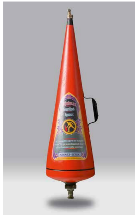
Minimax tragbarer Feuerlöscher »Spitztüte« circa 1920