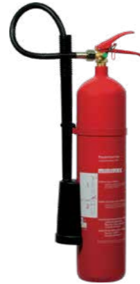
Kohlendioxidlöschers Dauerdruckgerät CS 5c Brandklasse B